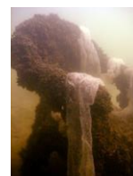
STOEL MET KUIT

Het onderwaterleven in de Kraaijenbergseplassen is rijk aan begroeiing en aan vis. Op diverse plaatsen. Voor zover door amateurs te beoordelen lijkt de plas gezond te zijn met helder water waarin diverse planten en diersoorten leven. Tot ca. 10 meter is er begroeiing waar te nemen. In de diepere gedeelten komt te weinig licht voor om deze begroeiing door te zetten. Harde substraten worden gebruikt door vissen om kuit op te schieten.